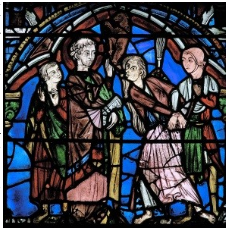
Vitrail de Saint Chéron—scène de guérison d'un 'possédé': la femme atteinte de démence, le saint, un serviteur et un témoin.

Dans la fenêtre consacrée à saint Chéron, saint chartrain aux forts pouvoirs guérisseurs, depuis peu ordonné prêtre, on lui amène une femme 'possédée'. Celle-ci a les bras liés par une corde, que tient un serviteur. Comme on le voit, ce dernier a même un fouet dont on ignore s'il s'en sert pour se défendre ou calmer la femme dans ces accès de fureur. Ici, le verrier a représenté un visage exorbité, la langue pendue. Les très longs cheveux déliés doivent aussi être compris comme un code : elle néglige son apparence et retourne à une sorte de 'furie' primordiale. La bénédiction du saint entraîne le diable hors du corps. On voit celui-ci s'échapper.